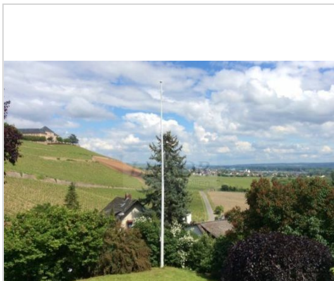
Ausblick auf das Schloss

Geisenheim im Rheingau ist knapp 30 Minuten von Wiesbaden entfernt. Hier heißen Sie Weingüter, das Schloss Johannisberg und eine tolle Aussicht herzlich willkommen. Für Jogger, Fahrradfahrer und Spaziergänger bietet Geisenheim eine große Vielfalt an Wegen. Nach Wiesbaden führt die B42, die Fähre in Oestrich-Winkel bringt Sie in 10 Minuten auf die Ingelheimer Rheinseite.