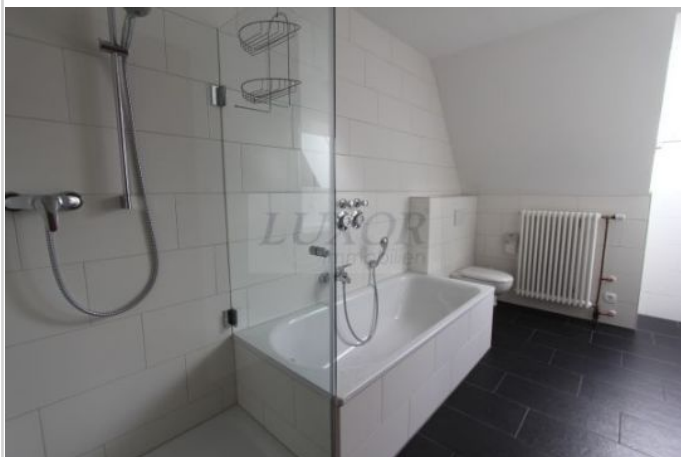
Dusch- und Wannenbad

Zimmer: 4,00 Wohnfläche ca.: 146,00 m 2 Kaltmiete: 1.100,00 EUR (zzgl. Nebenkosten) Gesamtmiete: 1.400,00 EUR